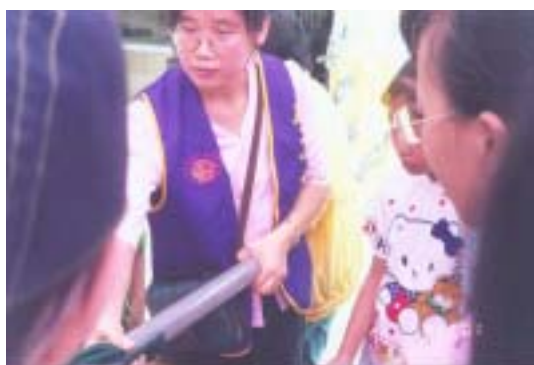
圖三：林園媽媽皮卡丘

學校不是唯一學習科學的地方與方式，從社會與家庭著手的科學教育，是幫助學生學習成長的另一個重要途徑。很多人在街頭物理的現場上，看到小朋友從小培養科學興趣，不免讓人妄想往後美景，甚至夢想未來的楊振寧先生、李遠哲先生就這些人群裡。我們看到更多，那些帶小朋友來的爸爸媽媽，學的比誰都認真起勁，他們喜歡科學後，會幫助社會與家庭科學教育發揮更大作用。