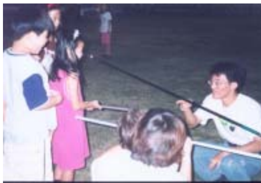
圖四：彈奏物理的民歌手操作如何長竹竿找重心

前幾天在全國物理科能力決賽場合上，終於等到晚上空檔時，把握機會把跳豆、蟋蟀、皮卡丘、吸鐵人等等，帶去讓這群全國物理的頂尖高中生感受，相信其中幾位會很快地加入皮卡丘俱樂部。或許有幾位將來在醫生、電機、物理門前徘徊時，這樣曾經的經歷會幫忙他們做決定。看到今年大一新生中，有人拿著街頭物理的玩意兒來物理系報到，不免期望著街頭物理多到高中走走，或許能夠網羅更多後起之秀投身物理。相信有朝一日，這些人成了物理研究的佼佼者，會想到用更多活潑淺顯的語言，去讓更多的門外漢分享他的物理之美。