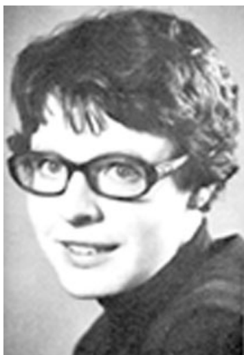
大約 1970 年時的約瑟林·貝爾

1967年，當時還是天文學系研究生的約瑟林·貝爾（Jocelyn Bell）注意到她的無線電波望遠鏡傳來的資料中有一些奇怪的「少許雜訊」，她和她的指導教授安東尼·赫維斯（Anthony Hewish）起初以為他們可能偵測到來自外星生物的訊