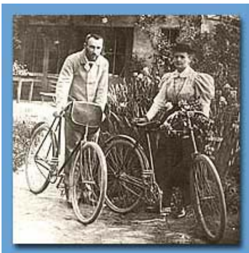
蜜月期間的居禮夫婦