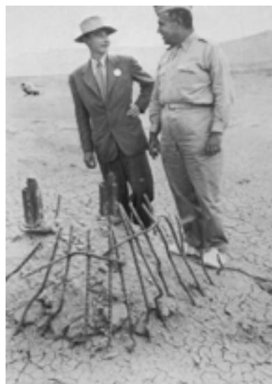
歐本海默(左)和葛駱福(Leslie R. Groves)將軍

今日，無人會否認原子彈的成功發展永遠改變了世界的面貌。歐本海默(J. Robert Oppenheimer, 1904-1967)在負責三一測試，見證了原子彈的後續發展後說得極好，他說：「不管怎麼說，物理學家都已領悟到罪惡，這不是粗魯、幽默或是誇張就能完全抹滅的，而這也是他們無法忘記的知識。」